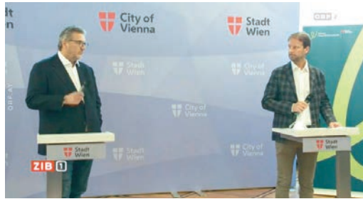
Im Oktober 2020 präsentierten der Wiener Gesundheitsstadtrat Peter Hacker und Prim. Manfred Greher von den Wiener Ordensspitälern die gemeinsamen Anstrengungen, die „zweite Covid-19-Welle“ zu meistern, ohne geplante Operationen verschieben zu müssen.

Nach einem intensiven 2020 hoffen wir auf ein gesundes und konstruktives 2021 – auch wir dürfen Sie bitten, sich gegen das Corona-Virus impfen zu lassen – es ist mit Sicherheit der beste Weg in Richtung Normalität! Information unter https://www.sozialministerium.at/Corona-Schutzimpfung.html